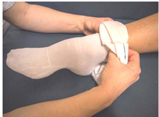
Fig. 1. Colocación de medias de compresión.

Para la Enfermería de nuestro centro, los TCAE son fundamentales para la prestación de unos cuidados de calidad. No solamente como profesionales competentes en cuidados básicos como la higiene, gestión de la incontinencia, cambios posturales, alimentación o hidratación, sino que también colaboran en labores tan importantes como la detección precoz de úlceras por presión (UPP) o lesiones por humedad, presencia de laceraciones o hematomas, etc. Además, también se encargan de la colocación y retirada de los sistemas de compresión de las extremidades inferiores: medias, dispositivos con velcro y demás (Fig. 1).