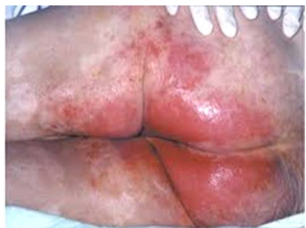
Fig. 5. Lesiones de humedad.

En cuanto a las lesiones de pie diabético, tenemos en marcha un protocolo de prevención en el centro basado en un control periódico (quincenal) de la salud de los pies de los residentes en general y de los diabéti-