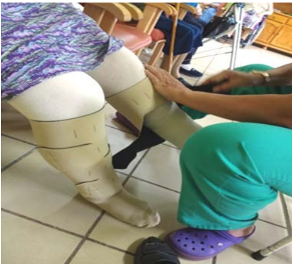
Fig. 4. Colocación sistema de compresión.

Recientemente hemos incorporado la terapia de compresión con baja elasticidad. Para su correcta aplicación es preciso contar con el valor de ITB, por lo que de momento trabajamos a baja compresión (20mmHg), en función de la tolerancia del paciente y siempre en extremidades con pulsos, por lo que hasta ahora no se han registrado complicaciones (Fig.4).